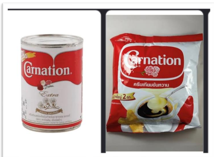
นมข้นหวานและนมสด