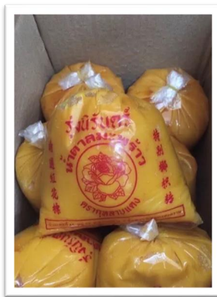
น้ำตาลปีบ