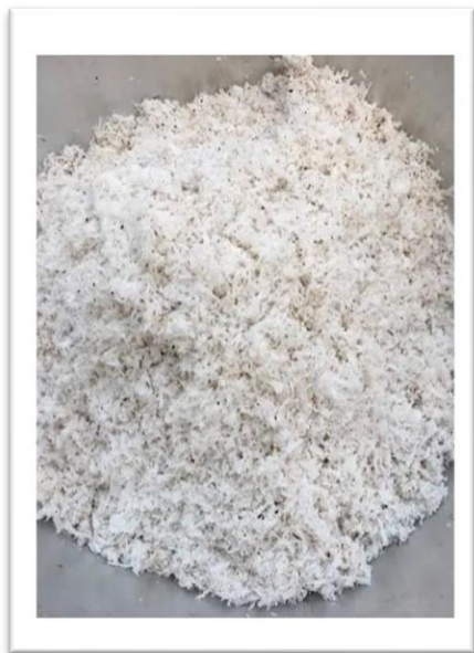
เนื้อมะพร้าว